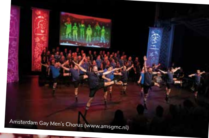
Amsterdam Gay Men's Chorus ( www.amsgmc.nl )

Важливо знати, що ви не зобов'язані займатися сексом в таких закладах, ви можете прийти туди як звичайний відвідувач. Персонал цих закладів допоможе вам почуватися в безпеці.